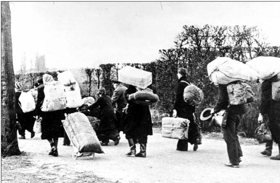
Cipekedő svábok a kitelepítéskor

Magyarországra már a középkorban megérkeztek az első németek: Erdélyben és a mai Szlovákia északi részén telepedtek meg a szászok, akik jellemzően városlakók voltak, jelentős részben hozzájuk kötődik a magyarországi városok és kereskedelem születése. A második nagy betelepítési hullám a 18. században következett be: a török háborúk okozta lakosságcsökkenést a bécsi udvar szervezett betelepítésekkel próbálta pótolni. Az ekkor Magyarországra költözött német csoportokat nevezzük sváboknak: ők főként a török háborúk által leginkább sújtott területeken, vagyis a Pest-Buda környékén, Fejér, Veszprém, Somogy és Tolna megyében, Duna-Tisza közén és néhány egyéb helyen telepedtek meg.